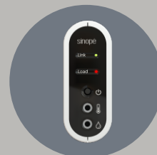
Contrôleur de chauffe-eau Calypso