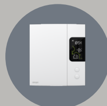
Thermostat pour plinthe électrique - 4000W