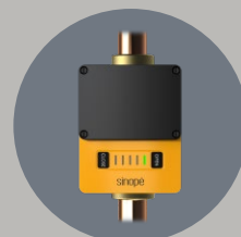
Système de protection contre les dégâts d'eau Sedna