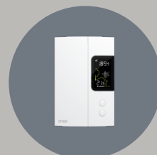
Thermostat pour plinthe électrique - 3000W