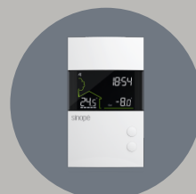
Thermostat pour plancher chauffant Thermostat basse tension